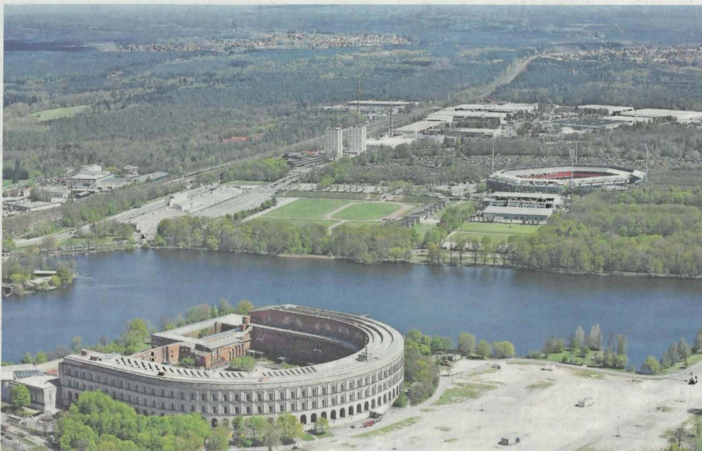
Dokuzentrum, Steintribüne, Dutzendteich, Max-Morlock-Stadion, Grundig-Türme, Zeppelinfeld, Arena Nürnberger Versicherung... Um all das auf ein Foto zu bekommen, muss man abheben. Wie es Luftbildfotograf Oliver Acker getan hat.

Freitag · 19. Oktober 2018 · STADT · Seite 35