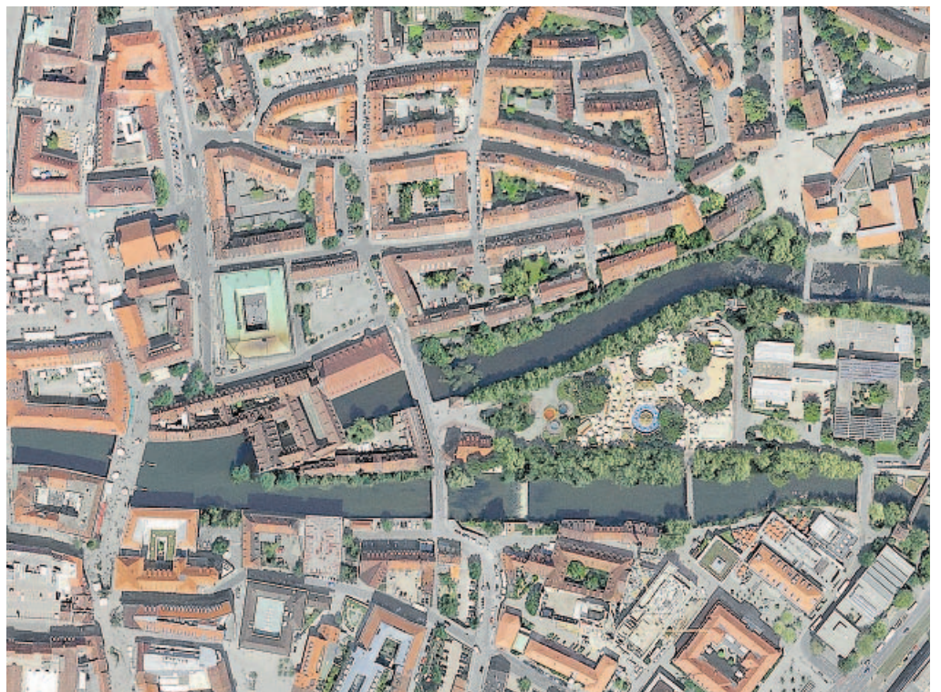
Dieser Ausschnitt aus Oliver Ackers Altstadtfoto zeigt die Insel Schütt inklusive Stadtstrand. Auch das Heilig-Geist-Spital und ganz links der Hauptmarkt lassen sich bestens erkennen.

begann. Der Schreiner, der nach dem Zivildienst beruflich beim Arbeiter-Samariter-Bund hängenblieb, kaufte sich vor sieben Jahren eine Kamera und fotografierte mit Vorliebe kleine Dinge, Insekten zum Beispiel. Doch als er eines Tages mit dem Fahrrad von seiner Wohnung in der